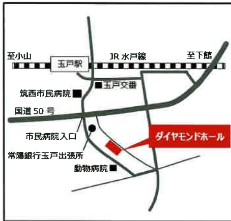
【筑西会場】ダイヤモンドホール 1階アーベントヴィラ

所在地: 水戸市白梅2-3-86 電話: 029-248-1122 ○JR常磐線水戸駅南口から徒歩20分 ○常磐自動車道「水戸IC」より20分 ○北関東自動車道「水戸南IC」より10分 ※お車でお越しのお客様は、フェリヴェール サンシャイン 専用駐車場(無料)をご利用ください。