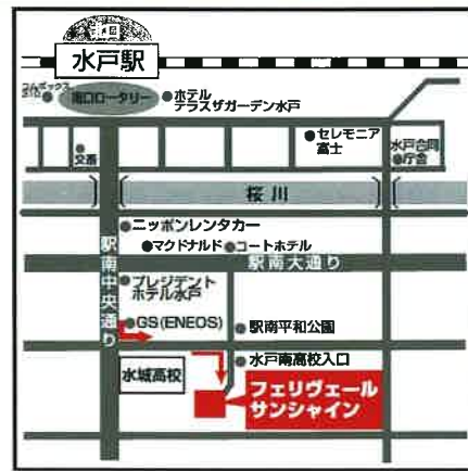
【水戸会場】フェリヴェール サンシャイン 1F シェルセラン

所在地: つくば市吾妻1-14-2 電話: 029-851-2132 ○TXつくば駅A3出口から徒歩2分 ※お車でお越しのお客様は、南2駐車場をご利用ください。