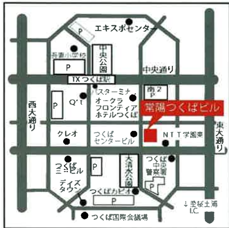
【つくば会場】常陽つくばビル 10階大会議室

所在地: つくば市吾妻1-14-2 電話: 029-851-2132 ○TXつくば駅A3出口から徒歩2分 ※お車でお越しのお客様は、南2駐車場をご利用ください。