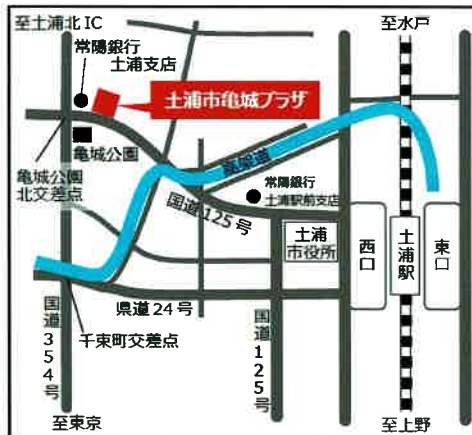
【土浦会場】土浦市亀城プラザ 1階 大会議室 2

所在地: 筑西市玉戸 1053-4 電話: 0296-28-8511 ○JR水戸線玉戸駅 から徒歩 10分 ○北関東自動車道「桜川筑西IC」から 40分 ○常磐自動車道「谷和原IC」から 60分 ※お車でお越しのお客様は、ダイヤモンドホール駐車場 (無料) をご利用ください。